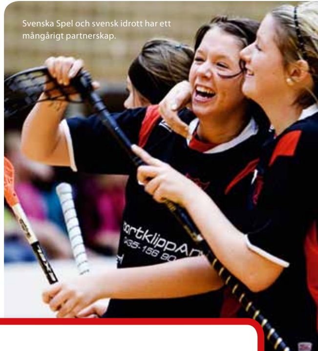
Svenska Spel och svensk idrott har ett mångårigt partnerskap.

Läs om Socialt ansvar och spelansvar på sidan 111